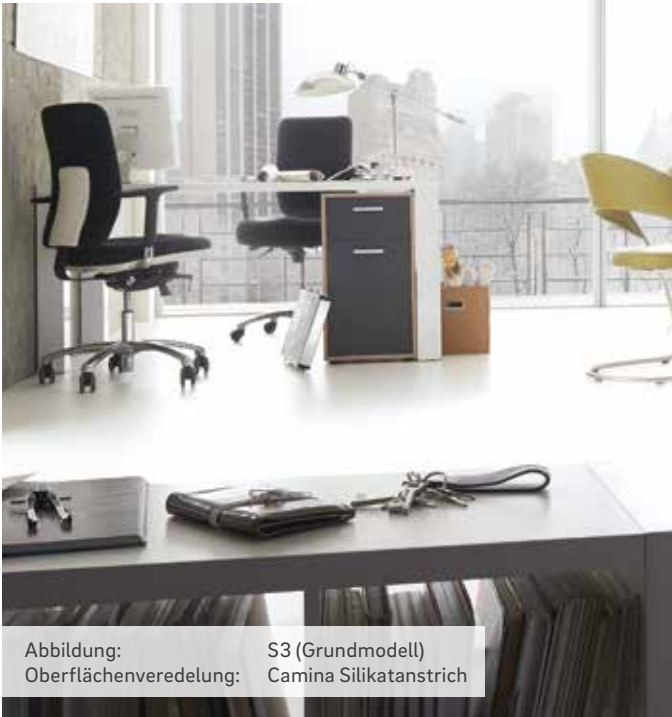
Abbildung: S3 (Grundmodell) Oberflächenveredelung: Camina Silikatanstrich