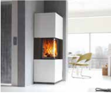
Abbildung: S3 in Kombination mit Designbeton Oberflächenveredelung: Camina Silikatanstrich